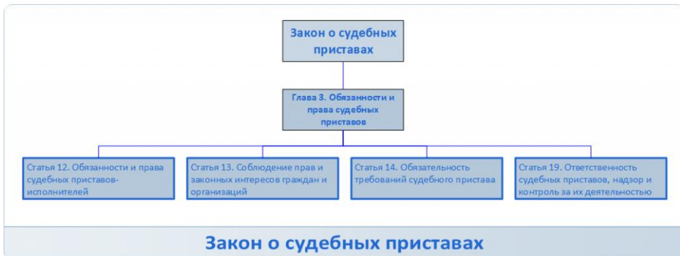
Рисунок 3 – Основные обязанности и права судебных приставов по ФЗ-№118

В соответствии со ст. 50 Федерального закона № 229-ФЗ стороны исполнительного производства вправе знакомиться с материалами исполнительного производства, делать из них выписки, снимать с них копии, представлять дополнительные материалы, заявлять ходатайства, участвовать в исполнительных действиях, давать устные и письменные объяснения в процессе производства исполнительных действий, приводить свои доводы по всем вопросам, возникающим в ходе исполнительного производства, возражать против ходатайств и доводов других лиц, участвующих в исполнительном производстве, оспаривать, обжаловать постановления судебного пристава-исполнителя, его действия (бездействие), а также имеют иные права, предусмотренные законодательством Российской Федерации об исполнительном производстве. До окончания исполнительного производства стороны исполнительного производства вправе заключить мировое соглашение, утверждаемое судом. 1